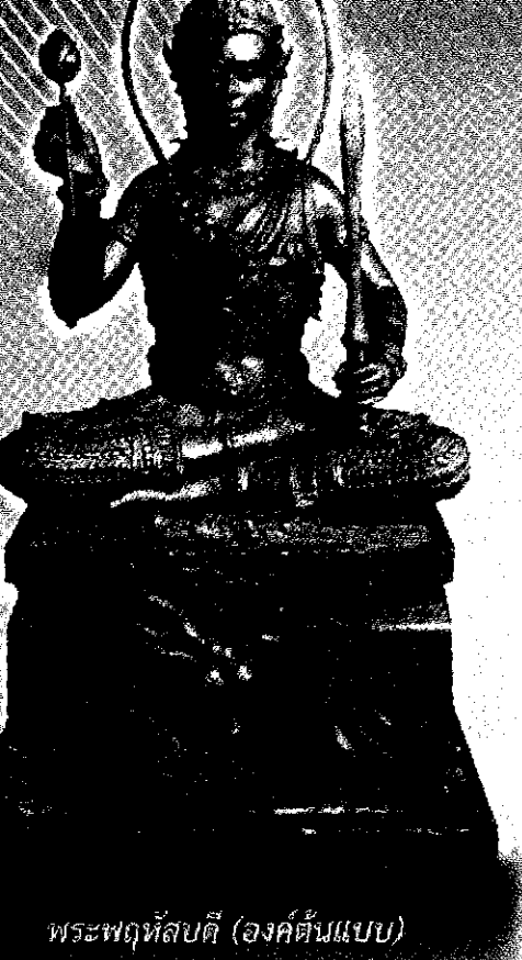
พระพญหัสติ (องค์ต้นแบบ)